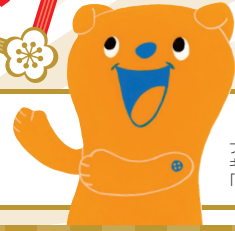
ブランドキャラクター「ユーモ」