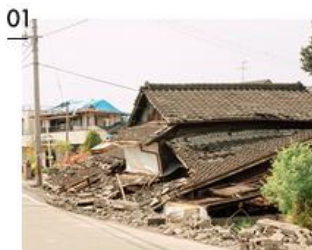
「未来は待っていても来ない」。災害復興から、新しいビジョンを描く西原村