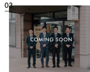
「災害公営なら熊本銀行へ」思いが人を動かし、やがて大きな実りとなる