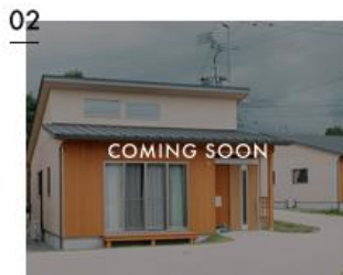
仮設住宅も注文住宅も、人が住むなら同じ快適さを。先進的な工務店が、災害住宅を建てたらこうなった