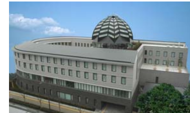
研修施設「FFG人財開発センター」 （平成19年4月開所）