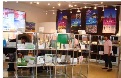
商品展示スペース

中国ビジネスを志向する企業に、商品の展示・販売や技術PRを行う拠点を提供し、中国における「販路拡大」「取引先発掘」「ニーズ調査」を支援いたします。