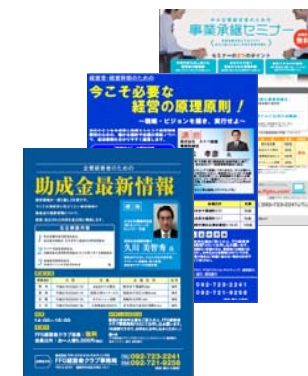
各種セミナーパンフレット