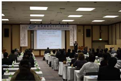
医療経営セミナー