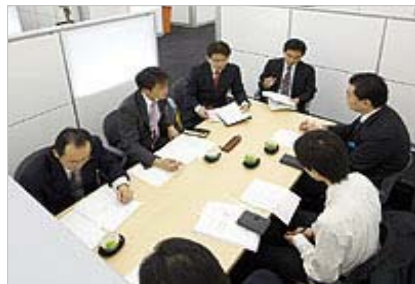
ビジネスマッチングフロア (福岡銀行本店ビル5Fに常設)