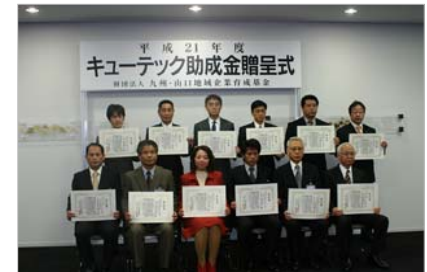
平成21年度 助成金贈呈式

当財団では、九州・山口地域における地域経済振興並びに中小企業の発展に貢献することを目的に、新技術・新製品の研究開発や、技術志向型中小企業が行う人材育成に対する助成金の交付を行っています。