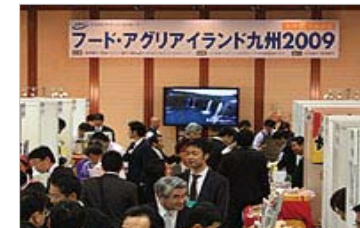
福岡銀行本店ビル10F