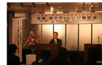
セミナー「中国への販路開拓」