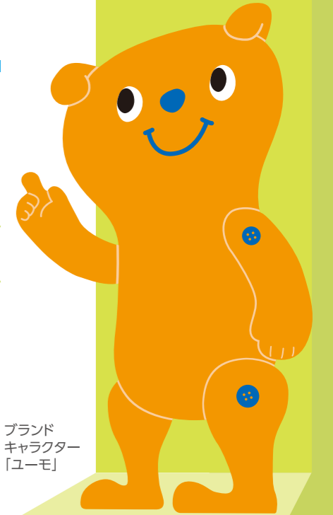
ブランドキャラクター「ユーモ」